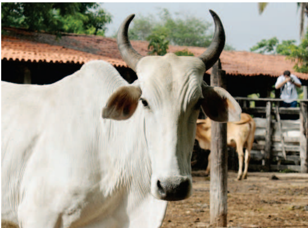
Campanha de Vacinação contra Febre Aftosa - 2014

“A partir da certificação, o nosso produto poderá circular no mundo e assim poderemos conquistar novos mercados. Além disso, com o reconhecimento internacional, várias empresas também vão se interessar em investir em nossa região. Até porque, somos o 2º maior produtor de caprino e o 3º de ovino do país”, afirmou.