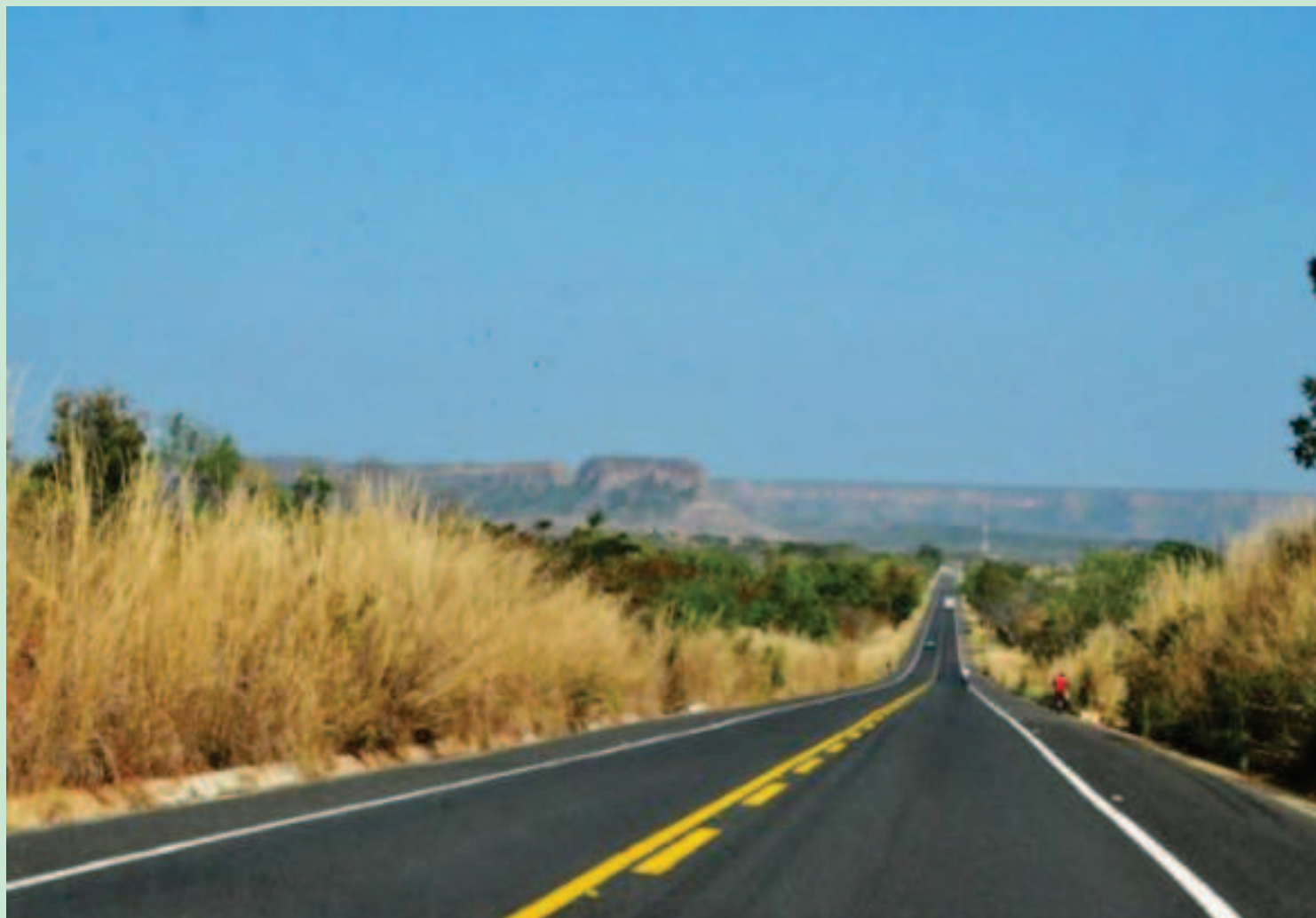
Mobilidade urbana nos municípios

As estradas vicinais que ligam os municípios de Paulistana a Curral Novo, beneficiando os povoados de Serra Vermelha, Itaizinho e Barro Vermelho. A obra possui 51 quilômetros de extensão e está orçada em R$21.321.036,61.