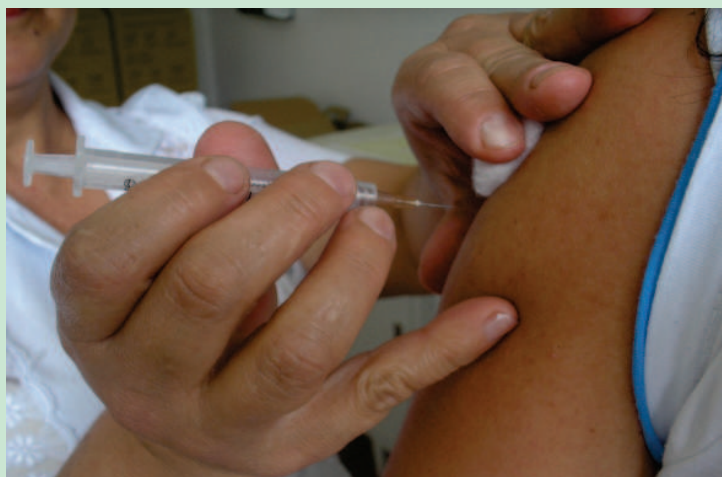
A vacina contra o HPV está disponível em todos os postos de saúde do Estado

Mírian Teles Da CCOM, com informações de Ministério da Saúde